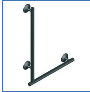
Winkelgriff E 31.2

Seit über 10 Jahren erfüllen Produkte von AMS diese Maxime, indem sie immer raffinierte Technik (patentierte Grifffsysteme) in einfache und handliche Formen verpackt. Sollten Sie also bei der Wahl eines Produktes auf durchdachte Technik, sowie einfaches, aber gleichzeitig hochwertiges Design Wert legen, sind Sie bei uns genau richtig.