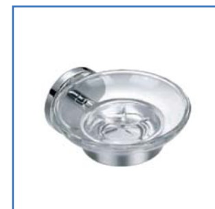
Seifenhalter E 1100