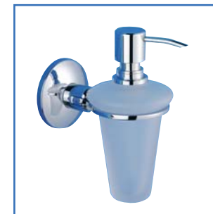
Seifenspender E 1200 Milchglas weiß