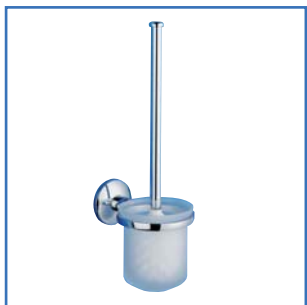
WC-Bürste E 1700 Milchglas weiß